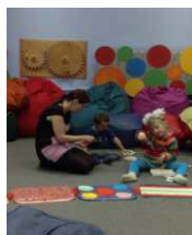
Что такое сенсорное развитие?