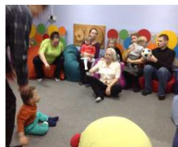
О чем говорят родители?