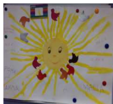
Почему важно играть с ребенком?